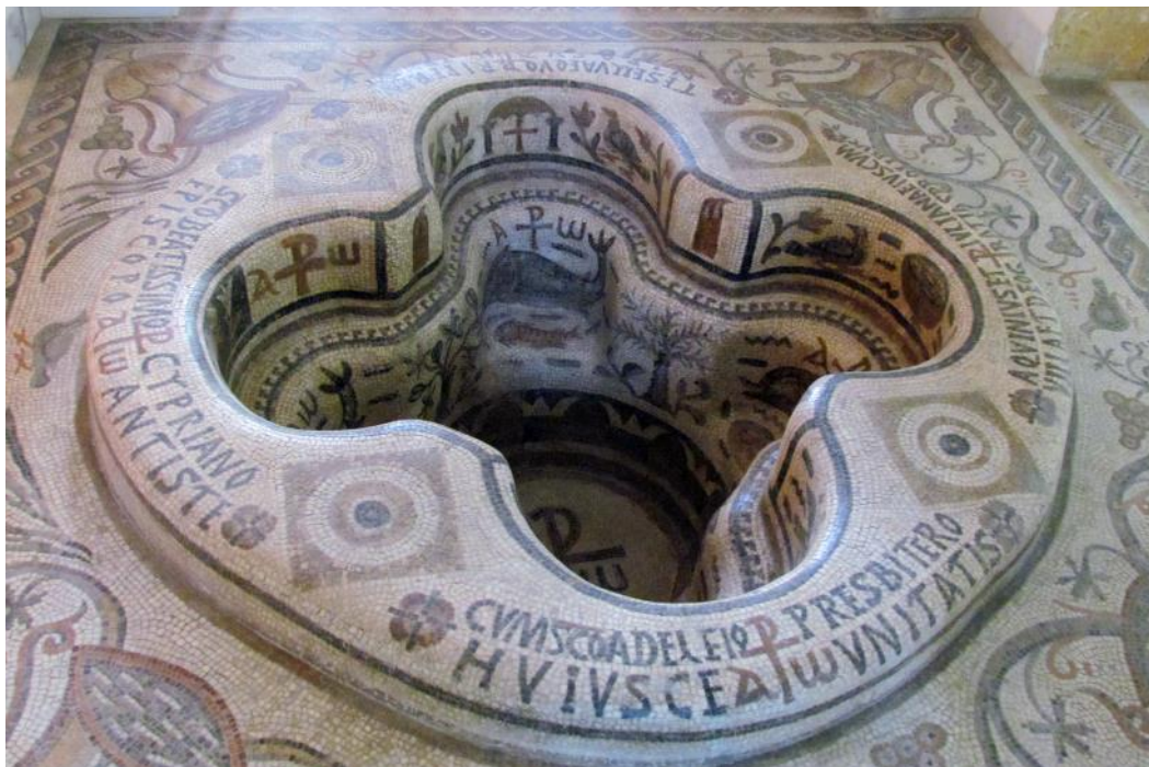
Cuve baptismale quadrilobe de Kélibia (Tunisie) avec son riche décor de mosaïques, VIe s.

S'il est vrai que le baptême est un « évènement », un acte passé pour la plupart, un signe posé une fois pour toutes,